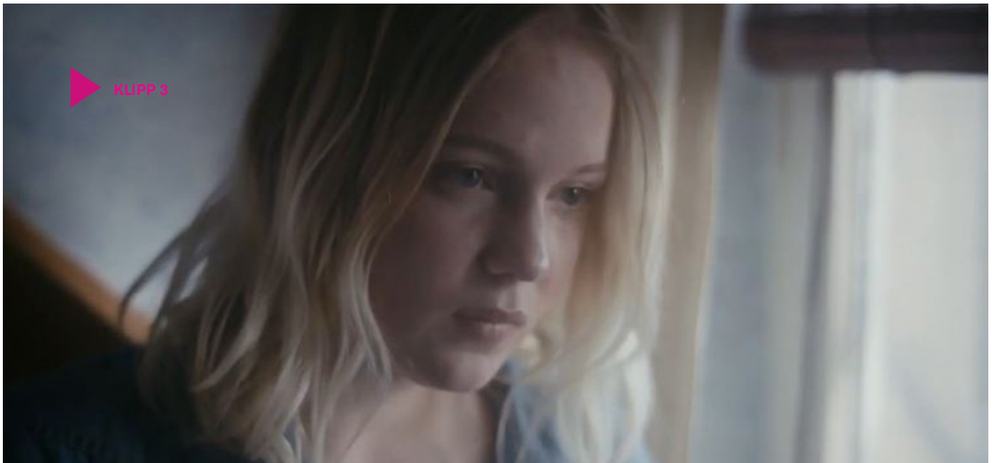
Klipp 3