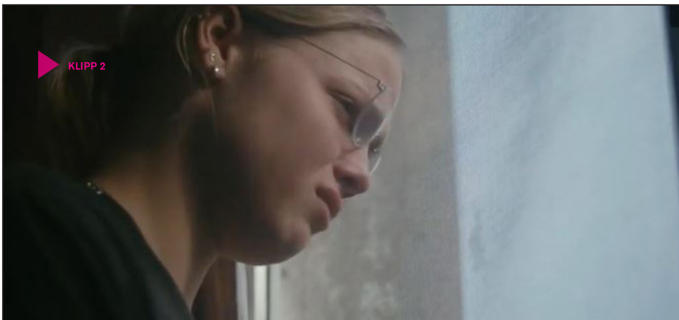
Klipp 2

hans skull. Men känslomässigt är de ett starkt team som behöver varandra.